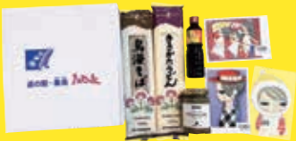
※写真は令和5年度の商品です