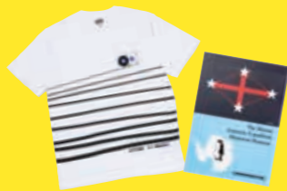
※賞品のサイズ・色は選べません